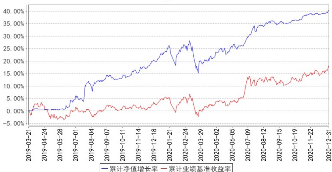
融通通盈灵活配置混合累计净值增长率与同期业绩比较基准收益率的历史走势对比图