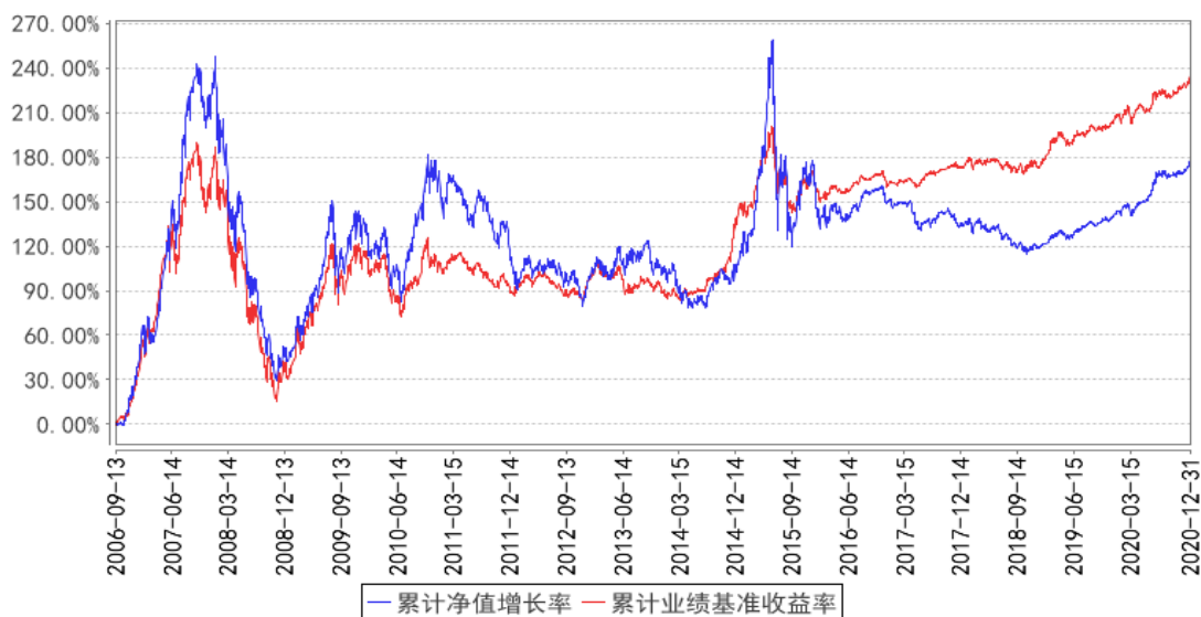
大成2020生命周期混合累计净值增长率与同期业绩比较基准收益率的历史走势对比图

注：1. 本基金合同规定，基金管理人应当自基金合同生效之日起六个月内使基金的投资组