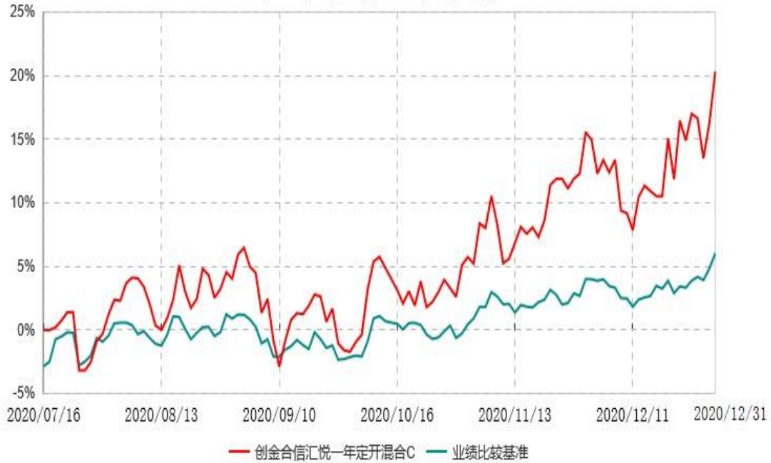
创金合信汇悦一年定开混合C累计净值增长率与业绩比较基准收益率历史走势对比图 (2020年07月16日-2020年12月31日)

注：1、本基金的基金合同于 2020 年 07 月 16 日生效，截至报告期末，本基金成立不满一年。 2、按照本基金的基金合同规定，自基金合同生效之日起六个月内使基金的投资组合比例符合本基金合同（第十二部分二、投资范围，三、投资策略和四、投资限制）的有关约定。本报告期本基金处于建仓期内。