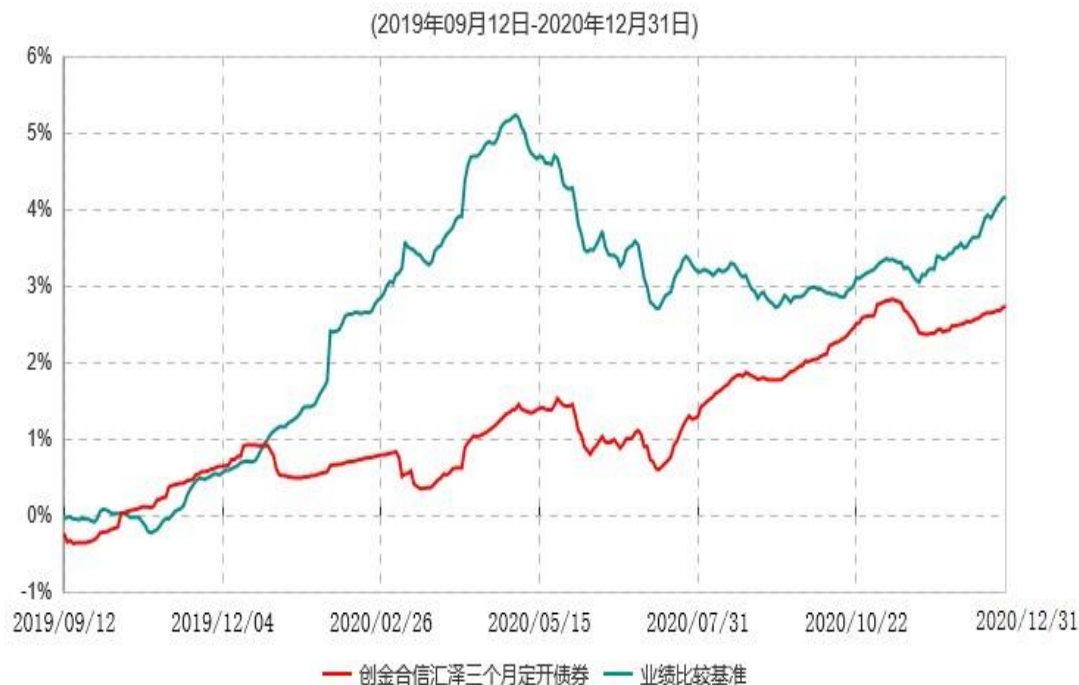
创金合信汇泽纯债三个月定期开放债券型证券投资基金累计净值增长率与业绩比较基准收益率历史走势对比图

注：本基金的合同生效日为2019年09月12日，本基金在6个月建仓期结束时，各项资产配置比例符合合同规定。