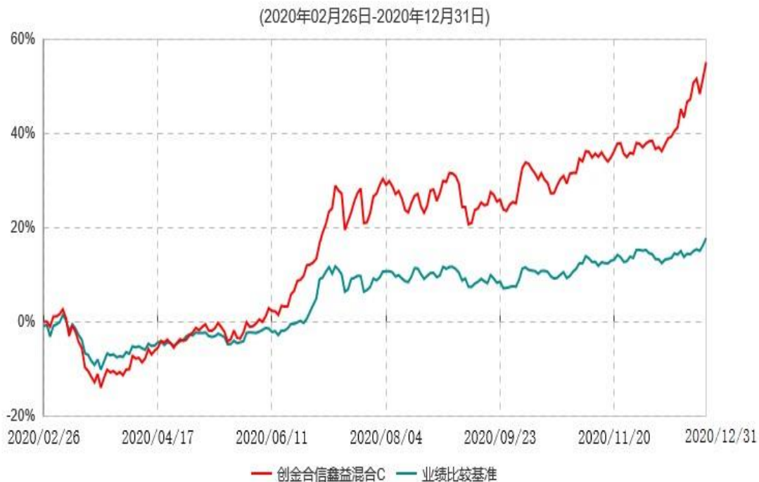
创金合信鑫益混合C累计净值增长率与业绩比较基准收益率历史走势对比图