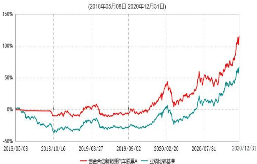
创金合信新能源汽车股票A累计净值增长率与业绩比较基准收益率历史走势对比图