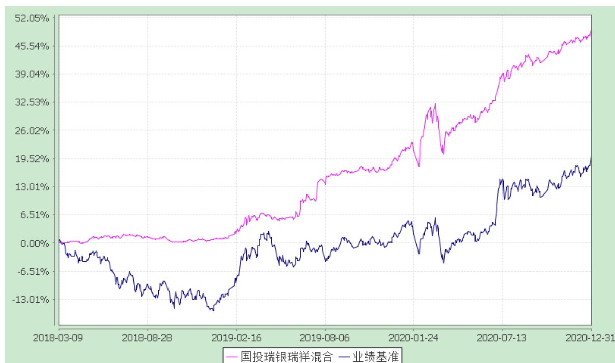
国投瑞银瑞祥灵活配置混合型证券投资基金 份额累计净值增长率与业绩比较基准收益率的历史走势对比图 (2018 年 3 月 9 日至 2020 年 12 月 31 日)

注：本基金建仓期为自基金转型日起的六个月。截至建仓期结束，本基金各项资产配置比例符合基金合同及招募说明书有关投资比例的约定。