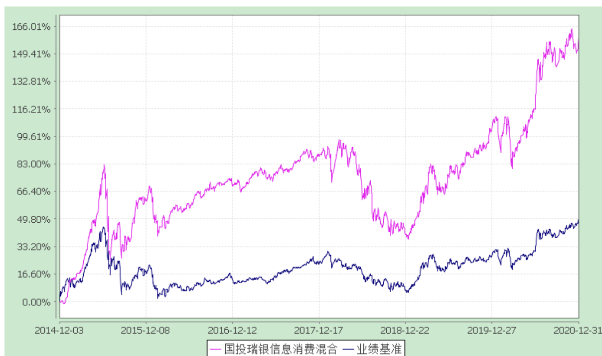
国投瑞银信息消费灵活配置混合型证券投资基金 份额累计净值增长率与业绩比较基准收益率的历史走势对比图 (2014 年 12 月 3 日至 2020 年 12 月 31 日)

注：本基金建仓期为自基金合同生效日起的 6 个月。截至建仓期结束，本基金各项资产配置比例符合基金合同及招募说明书有关投资比例的约定。