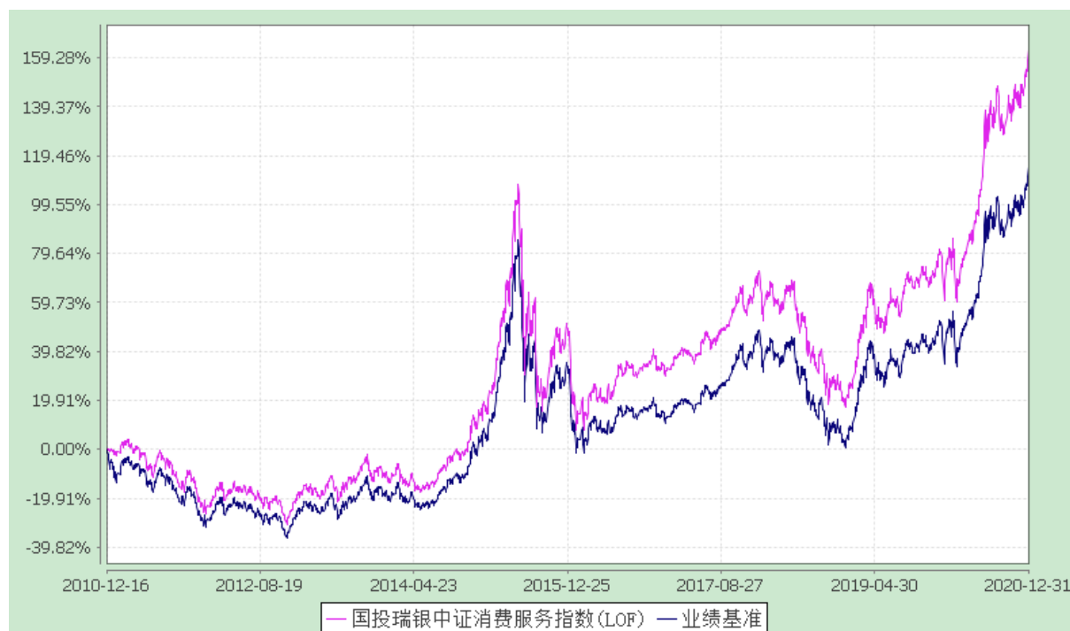
国投瑞银中证下游消费与服务产业指数证券投资基金（LOF） 份额累计净值增长率与业绩比较基准收益率的历史走势对比图 (2010 年 12 月 16 日至 2020 年 12 月 31 日)