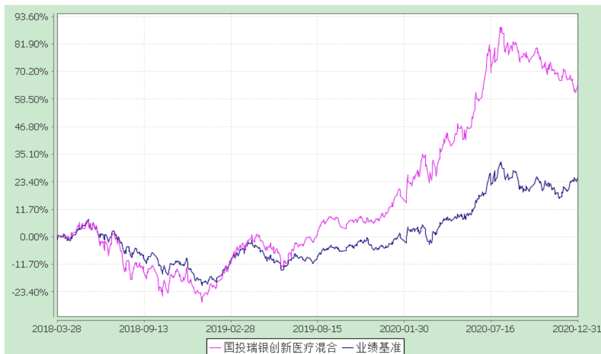
国投瑞银创新医疗灵活配置混合型证券投资基金 份额累计净值增长率与业绩比较基准收益率的历史走势对比图 (2018年3月28日至2020年12月31日)

注：本基金建仓期为自基金合同生效日起的6个月。截至建仓期结束，本基金各项资产配置比例符合基金合同及招募说明书有关投资比例的约定。