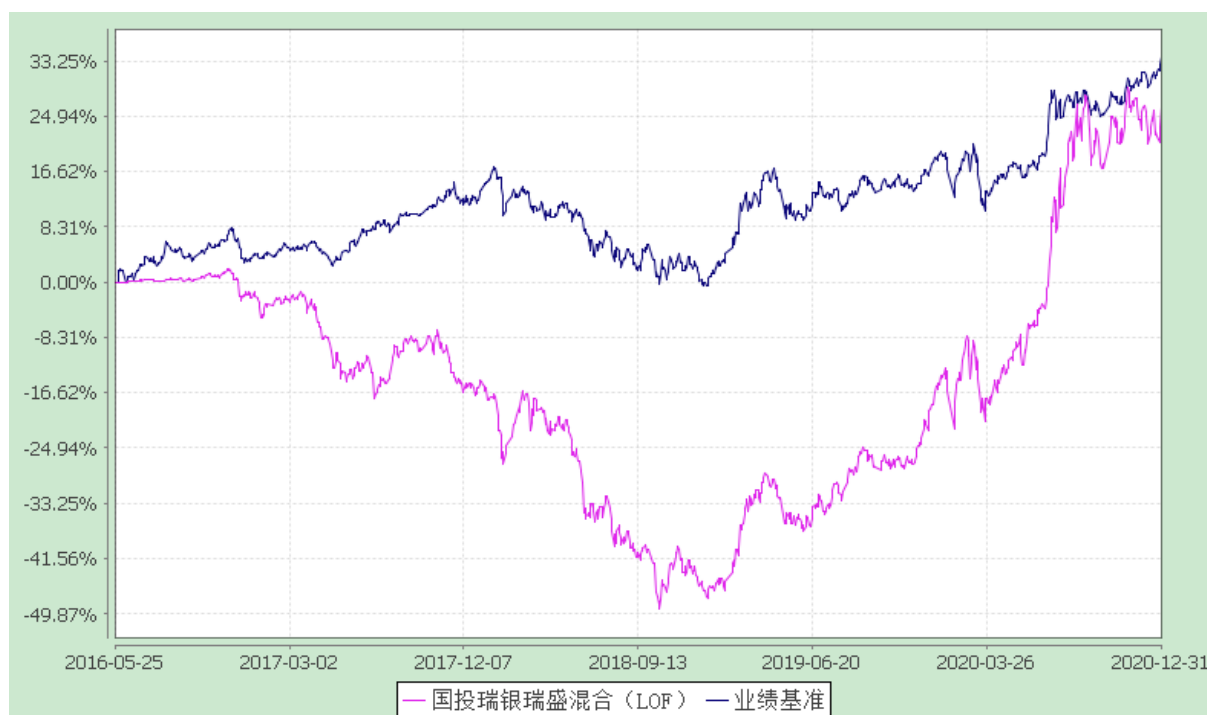
国投瑞银瑞盛灵活配置混合型证券投资基金(LOF) 份额累计净值增长率与业绩比较基准收益率的历史走势对比图 (2016 年 5 月 25 日至 2020 年 12 月 31 日)

注：本基金建仓期为自基金合同生效日起的六个月。截至建仓期结束，本基金各项资产配置比例符合基金合同及招募说明书有关投资比例的约定。