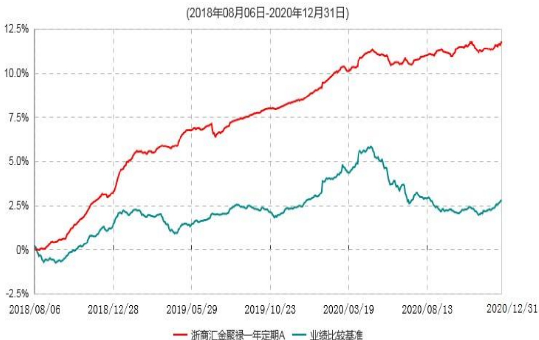
浙商汇金聚禄一年定期A累计净值增长率与业绩比较基准收益率历史走势对比图