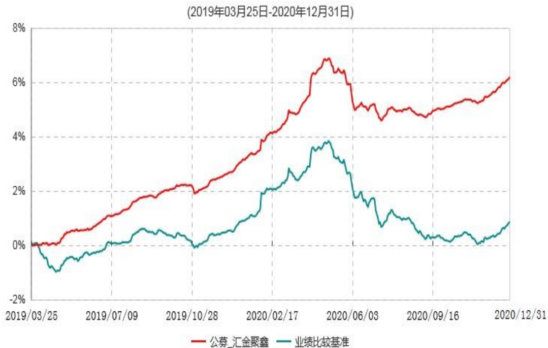
浙商汇金聚鑫定期开放债券型发起式证券投资基金累计净值增长率与业绩比较基准收益率历史走势对比图