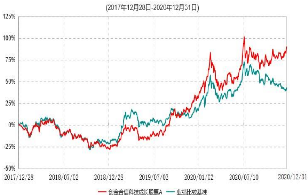
创金合信科技成长股票A累计净值增长率与业绩比较基准收益率历史走势对比图