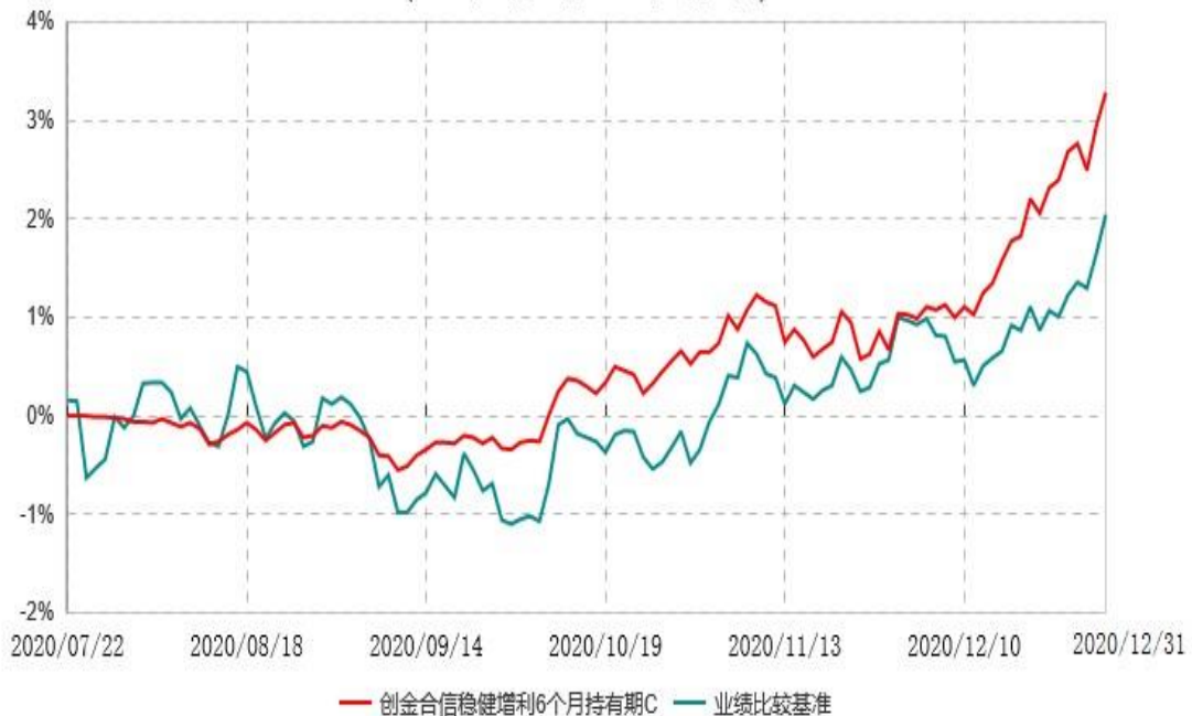
创金合信稳健增利6个月持有期C累计净值增长率与业绩比较基准收益率历史走势对比图 (2020年07月22日-2020年12月31日)

注：1、本基金的基金合同于 2020 年 07 月 22 日生效，截至报告期末，本基金成立不满一年。 2、按照本基金的基金合同规定，自基金合同生效之日起六个月内使基金的投资组合比例符合本基金合同（第十二部分二、投资范围，三、投资策略和四、投资限制）的有关约定。本报告期本基金处于建仓期内。