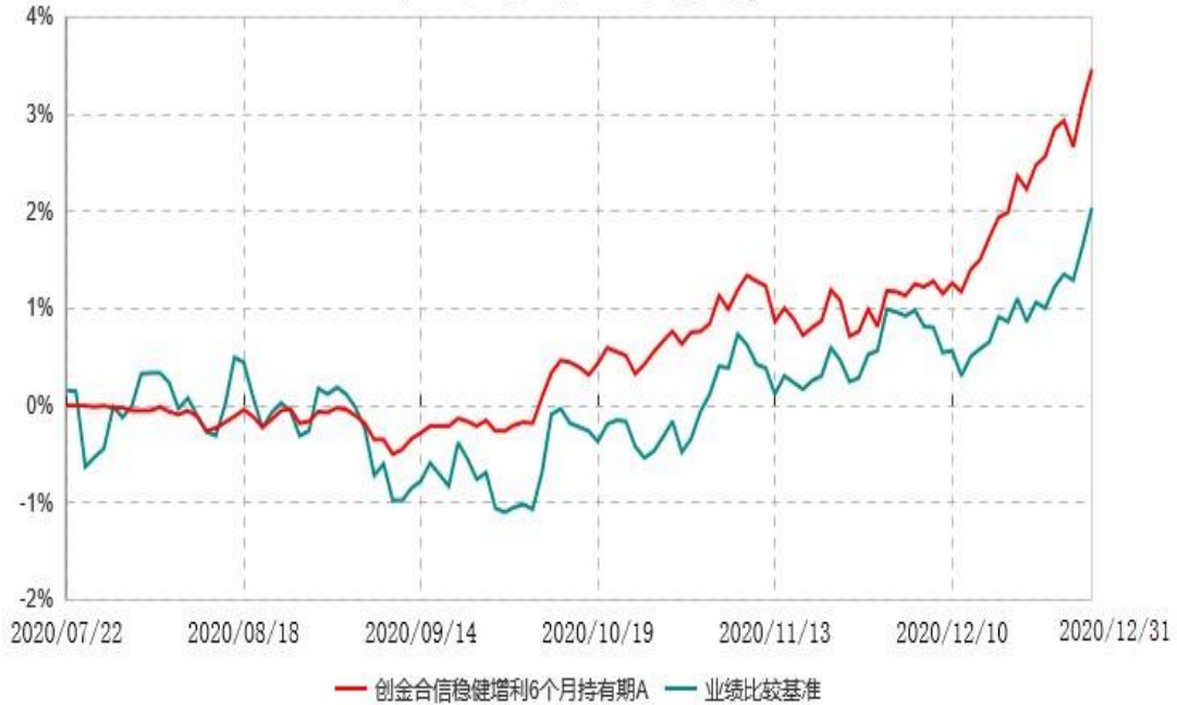
创金合信稳健增利6个月持有期A累计净值增长率与业绩比较基准收益率历史走势对比图 (2020年07月22日-2020年12月31日)

注：1、本基金的基金合同于 2020 年 07 月 22 日生效，截至报告期末，本基金成立不满一年。 2、按照本基金的基金合同规定，自基金合同生效之日起六个月内使基金的投资组合比例符合本基金合同（第十二部分二、投资范围，三、投资策略和四、投资限制）的有关约定。本报告期本基金处于建仓期内。