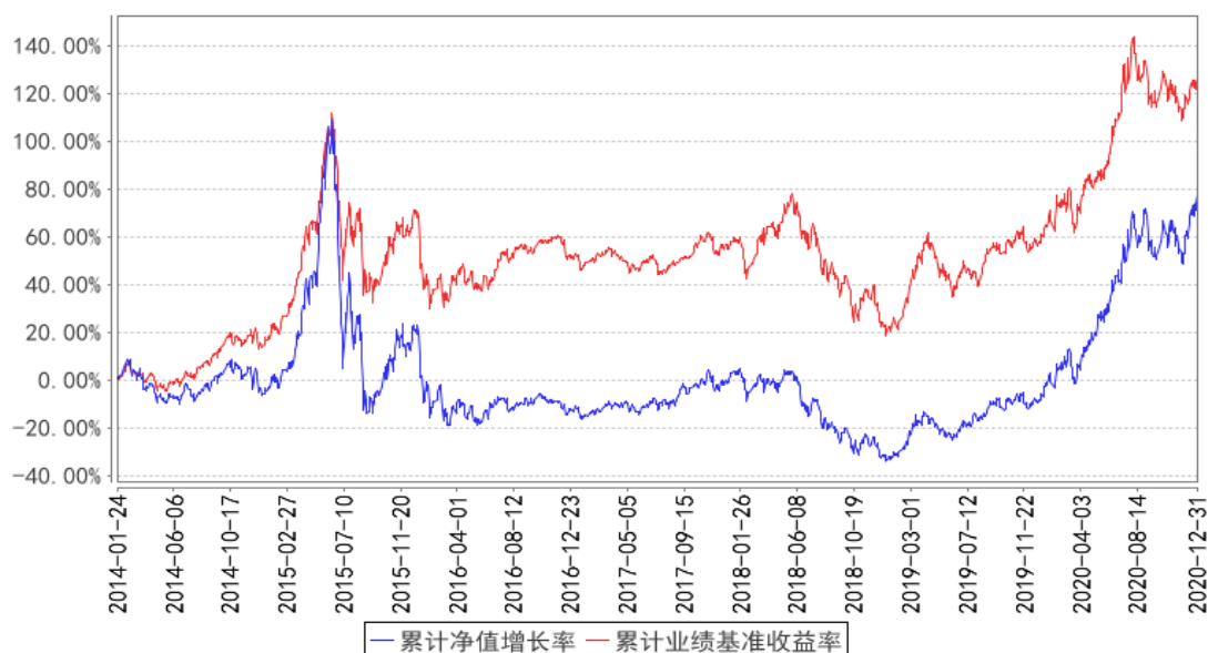
大成健康产业混合累计净值增长率与同期业绩比较基准收益率的历史走势对比图

注：1、根据中国证监会 2014 年 1 月 24 日下发的《关于大成中证 500 沪市交易型开放式指数证券投资基金联接基金基金份额持有人大会决议备案的回函》（基金部函[2014]51 号），大成中证 500 沪市交易型开放式指数证券投资基金联接基金转型为大成健康产业股票型证券投资基金，修改基金合同中的基金名称、基金类别、基金的投资目标、投资范围、投资理念和投资策略、业绩比较