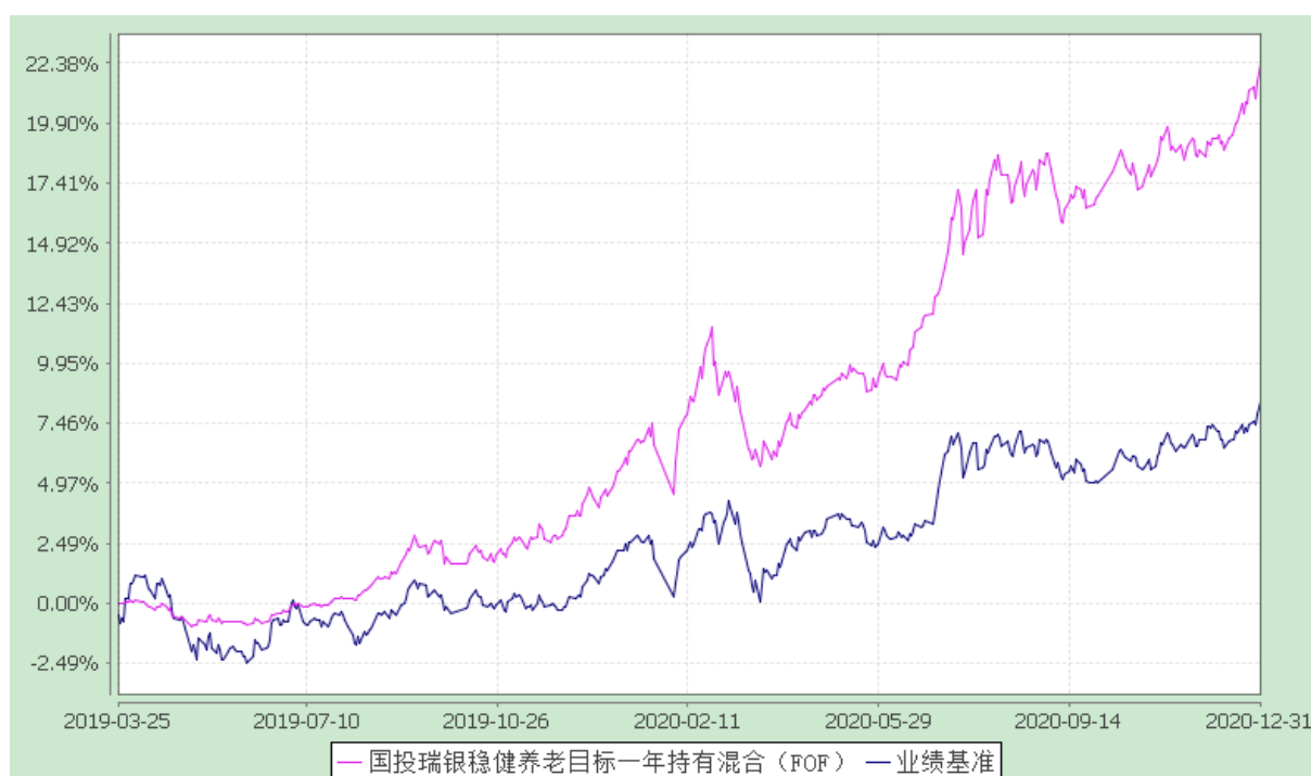
国投瑞银稳健养老目标一年持有期混合型基金中基金（FOF） 份额累计净值增长率与业绩比较基准收益率历史走势对比图 （2019 年 3 月 25 日至 2020 年 12 月 31 日）

注：本基金建仓期为自基金合同生效日起的 6 个月。截至建仓期结束，本基金各项资产配置比例复核基金合同以及招募说明书有关投资比例的规定。