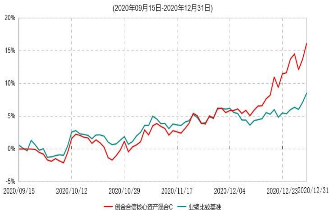
创金合信核心资产混合C累计净值增长率与业绩比较基准收益率历史走势对比图