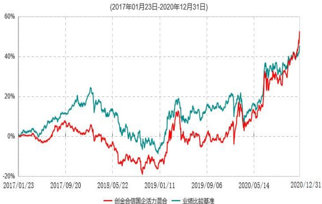
创金合信国企活力混合型证券投资基金累计净值增长率与业绩比较基准收益率历史走势对比图