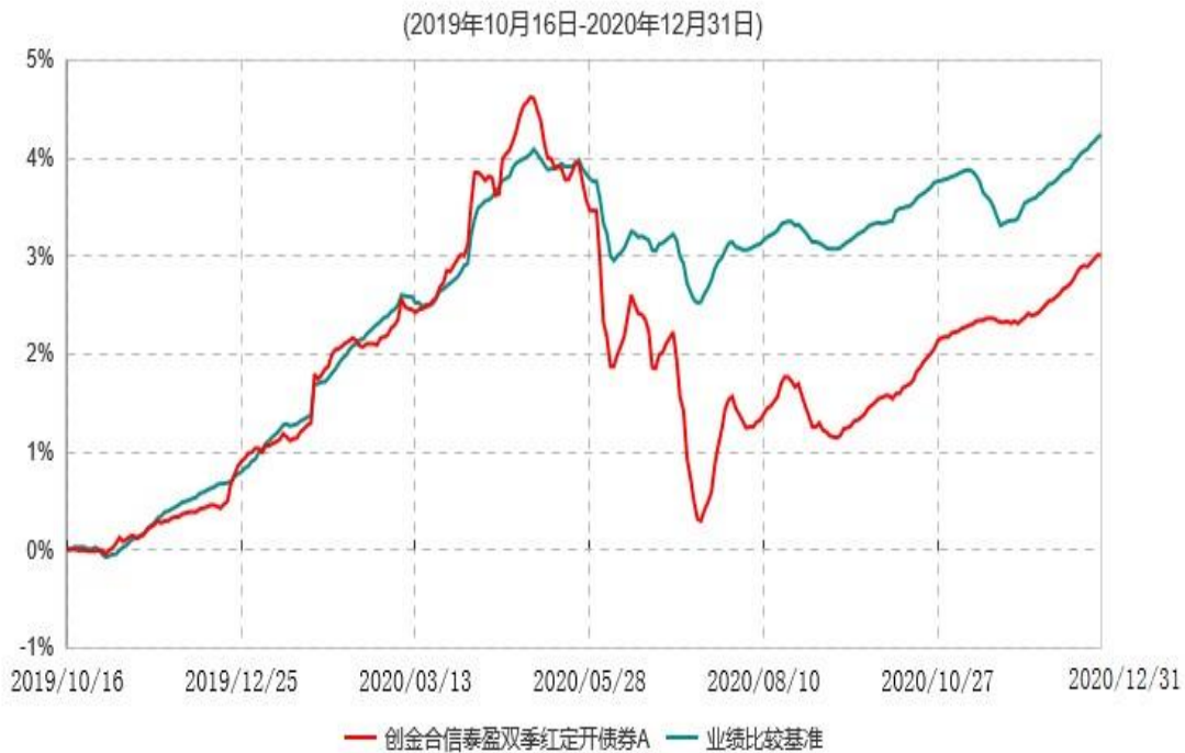
创金合信泰盈双季红定开债券A累计净值增长率与业绩比较基准收益率历史走势对比图