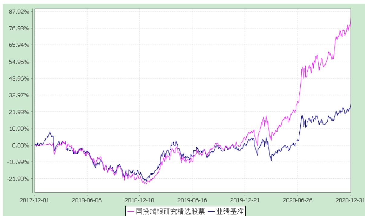
国投瑞银研究精选股票型证券投资基金 份额累计净值增长率与业绩比较基准收益率的历史走势对比图 (2017 年 12 月 1 日至 2020 年 12 月 31 日)

注：本基金建仓期为自基金合同生效日起的六个月。截至建仓期结束，本基金各项资产配置比例符合基金合同及招募说明书有关投资比例的约定。