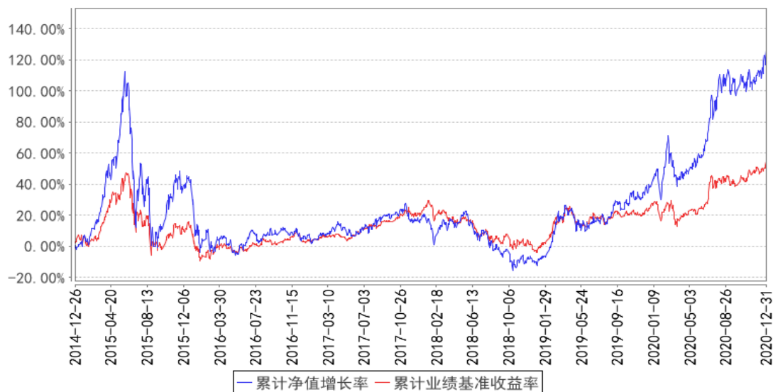
大成产业升级股票(LOF)累计净值增长率与同期业绩比较基准收益率的历史走势对比图

注：本基金于 2014 年 12 月 26 日转型，按基金合同规定，基金管理人应当自基金转型之日起六个月内使基金的投资组合比例符合基金合同的约定。建仓期结束时，本基金的投资组合比例符合基金合同的约定。