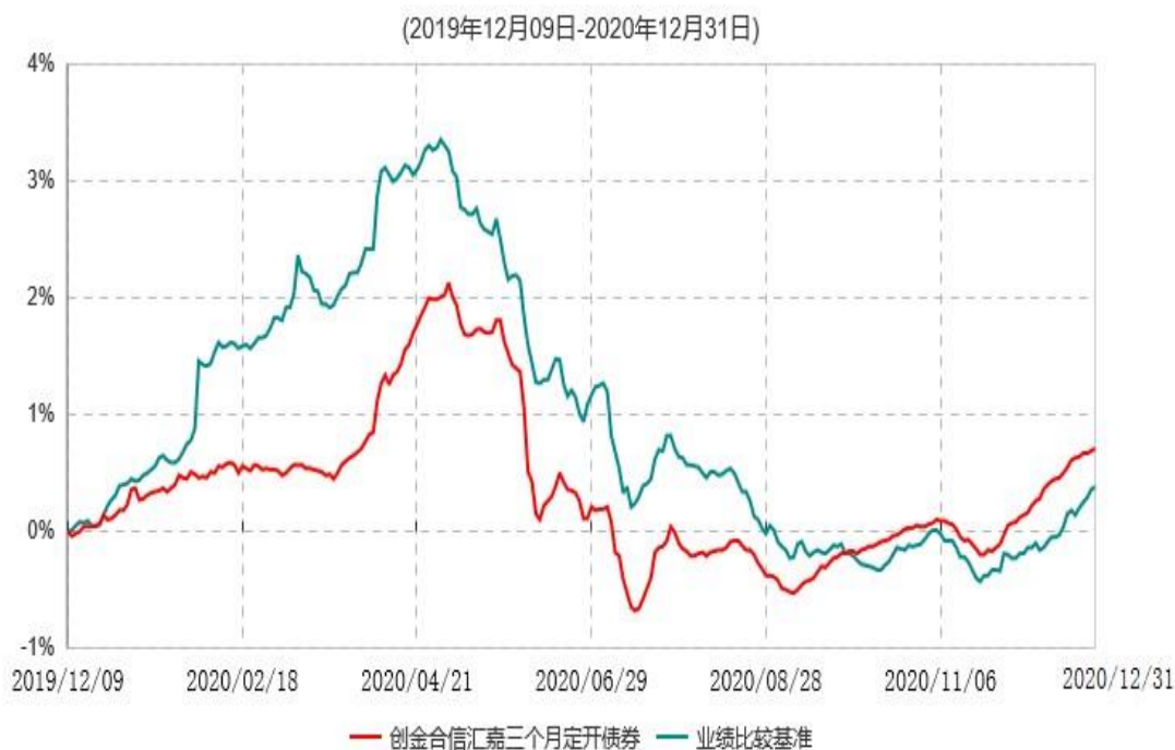
创金合信汇嘉三个月定期开放债券型发起式证券投资基金累计净值增长率与业绩比较基准收益率历史走势对比图

注：本基金合同生效日为2019年12月09日，本基金在6个月建仓期结束时，各项资产配置比例符合合同规定。