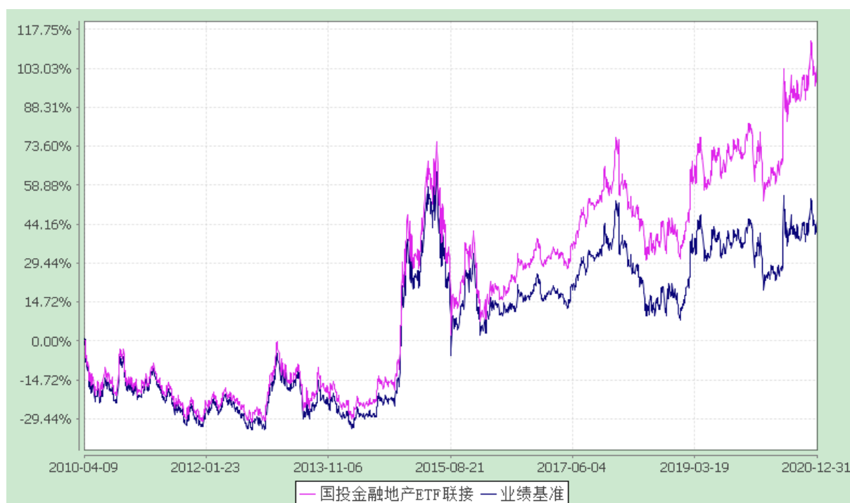
国投瑞银沪深 300 金融地产交易型开放式指数证券投资基金联接基金 份额累计净值增长率与业绩比较基准收益率的历史走势对比图 (2010 年 4 月 9 日至 2020 年 12 月 31 日)

注：2013 年 11 月 5 日起国投瑞银沪深 300 金融地产指数证券投资基金（LOF）转型变更为国投瑞银沪深 300 金融地产交易型开放式指数证券投资基金联接基金（简称“本基金”）。《国投瑞银沪深 300 金融地产交易型开放式指数证券投资基金联接基金基金合同》于 2013 年 11 月 5 日起生效。本基金建仓期为自基金合同生效日起的 3 个月。截至建仓期结束，本基金各项资产配置比例符合基金合同及招募说明书有关投资比例的约定。