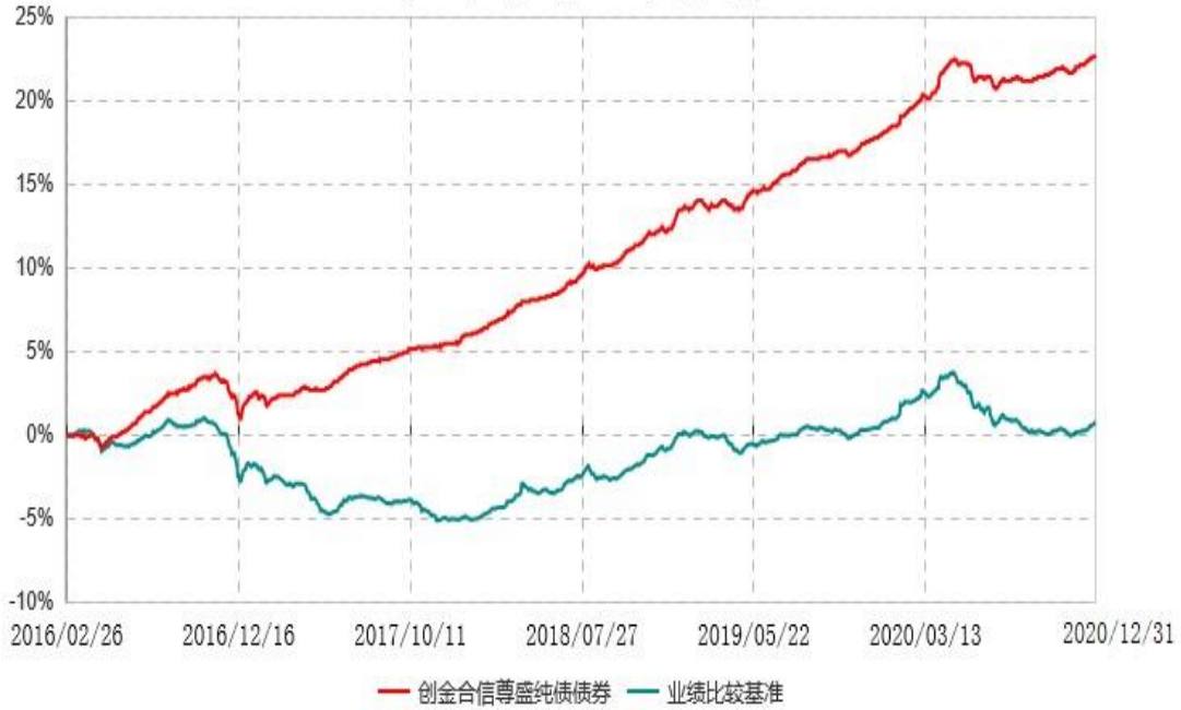
创金合信尊盛纯债债券型证券投资基金累计净值增长率与业绩比较基准收益率历史走势对比图 (2016年02月26日-2020年12月31日)