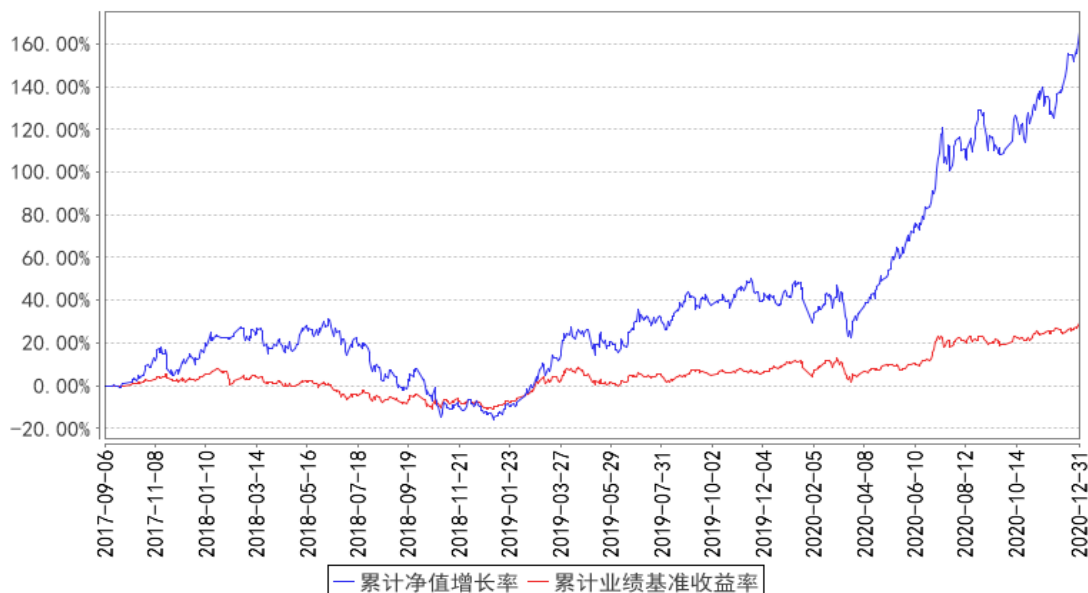
鹏华策略回报混合累计净值增长率与同期业绩比较基准收益率的历史走势对比图

注：1、本基金基金合同于 2017 年 09 月 06 日生效。2、截至建仓期结束，本基金的各项投资比例已达到基金合同中规定的各项比例。