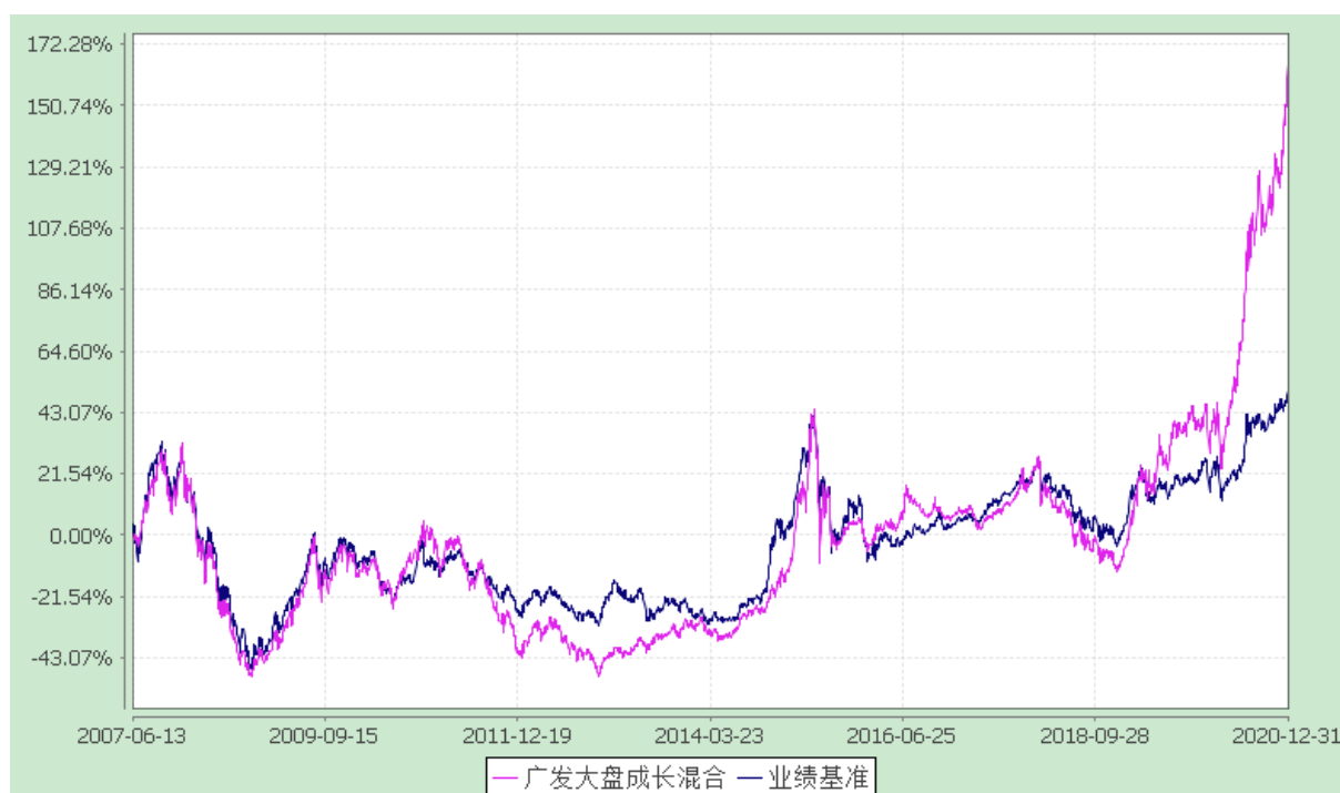
广发大盘成长混合型证券投资基金 份额累计净值增长率与业绩比较基准收益率的历史走势对比图 (2007年6月13日至2020年12月31日)