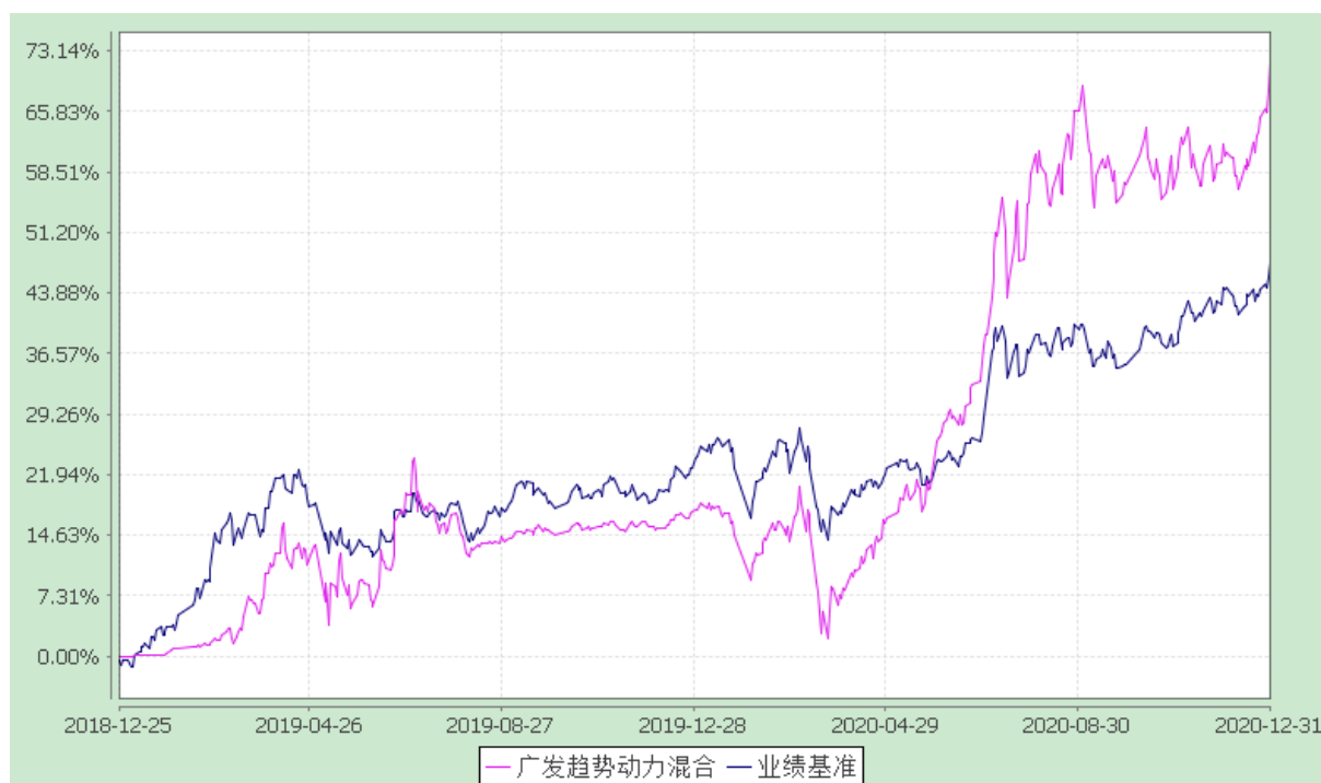
广发趋势动力灵活配置混合型证券投资基金 份额累计净值增长率与业绩比较基准收益率的历史走势对比图 (2018 年 12 月 25 日至 2020 年 12 月 31 日)