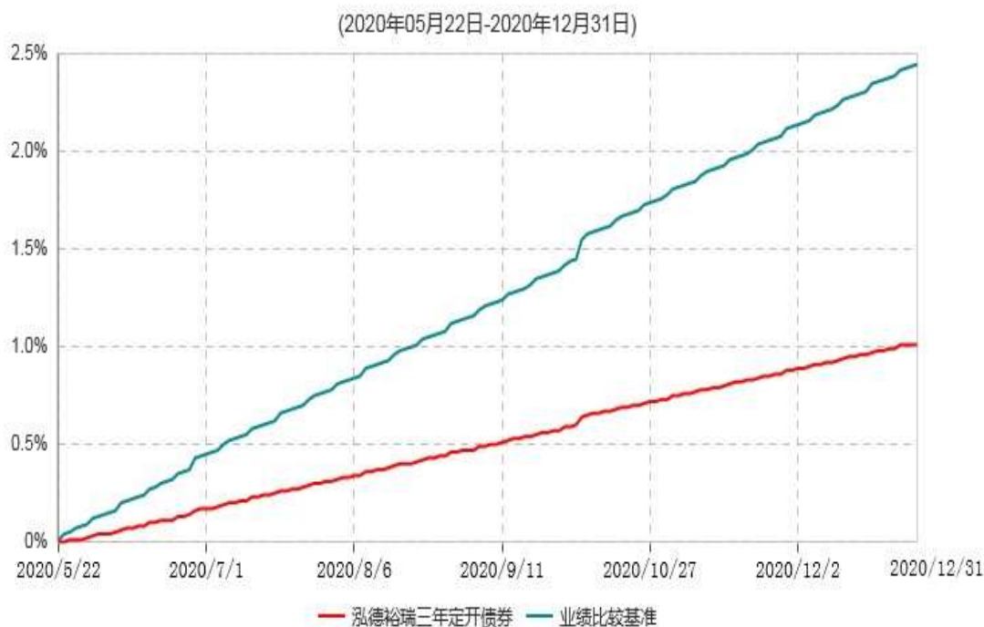
泓德裕瑞三年定期开放债券型发起式证券投资基金累计净值增长率与业绩比较基准收益率历史走势对比图

注：1、本基金的基金合同于2020年5月22日生效，截至2020年12月31日止，本基金成立未满1年。 2、根据基金合同的约定，本基金建仓期为6个月，截至报告期末，本基金的各项投资比例符合基金合同关于投资范围及投资限制规定。