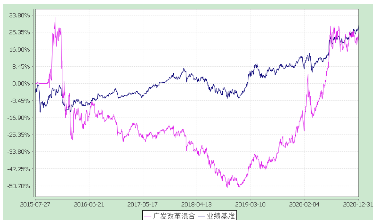
广发改革先锋灵活配置混合型证券投资基金 份额累计净值增长率与业绩比较基准收益率的历史走势对比图 (2015 年 7 月 27 日至 2020 年 12 月 31 日)