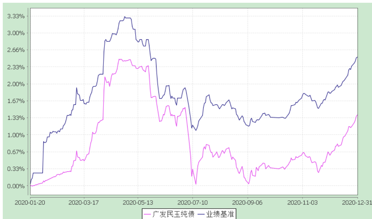
广发民玉纯债债券型证券投资基金 份额累计净值增长率与业绩比较基准收益率的历史走势对比图 (2020 年 1 月 20 日至 2020 年 12 月 31 日)

注：（1）本基金合同生效日期为 2020 年 1 月 20 日，至披露时点未满一年。