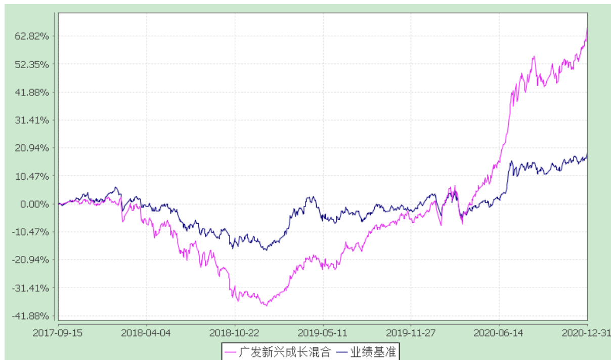
广发新兴成长灵活配置混合型证券投资基金 份额累计净值增长率与业绩比较基准收益率的历史走势对比图 (2017 年 9 月 15 日至 2020 年 12 月 31 日)