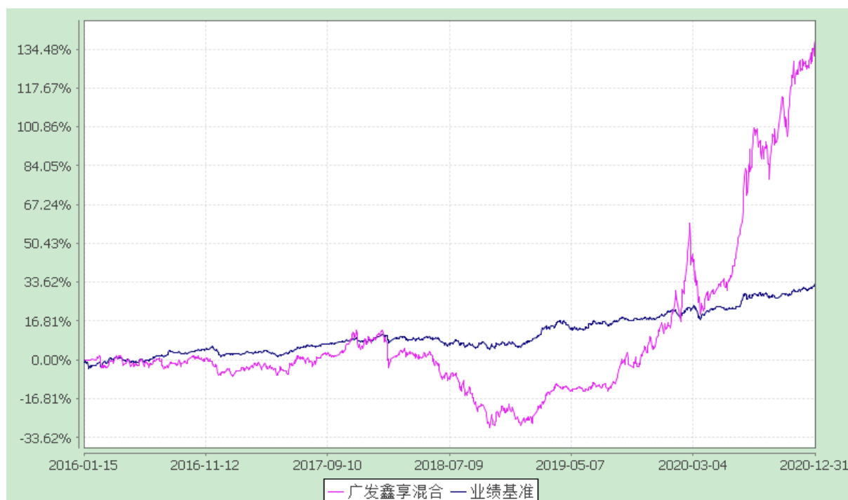
广发鑫享灵活配置混合型证券投资基金 份额累计净值增长率与业绩比较基准收益率的历史走势对比图 (2016 年 1 月 15 日至 2020 年 12 月 31 日)