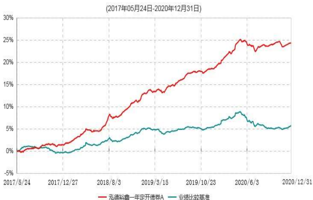
泓德裕鑫一年定开债券A累计净值增长率与业绩比较基准收益率历史走势对比图