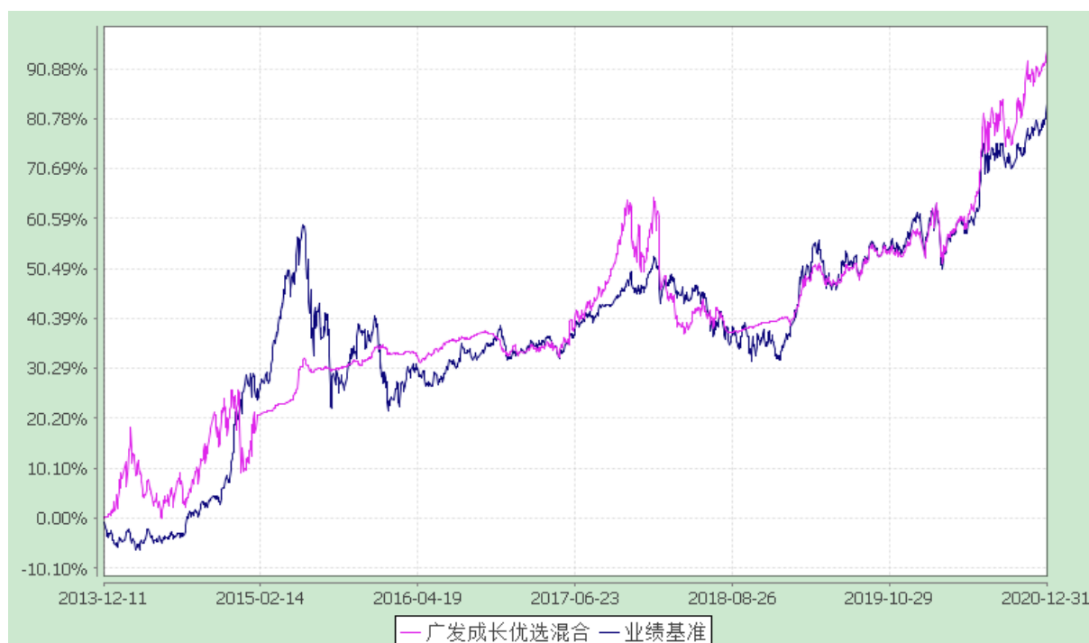
广发成长优选灵活配置混合型证券投资基金 份额累计净值增长率与业绩比较基准收益率的历史走势对比图 (2013 年 12 月 11 日至 2020 年 12 月 31 日)