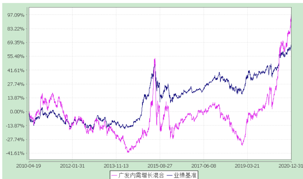
广发内需增长灵活配置混合型证券投资基金 份额累计净值增长率与业绩比较基准收益率的历史走势对比图 (2010年4月19日至2020年12月31日)