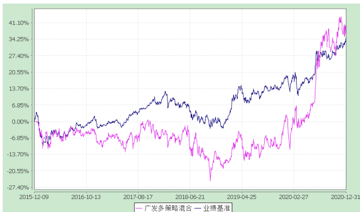
广发多策略灵活配置混合型证券投资基金 份额累计净值增长率与业绩比较基准收益率的历史走势对比图 (2015 年 12 月 9 日至 2020 年 12 月 31 日)