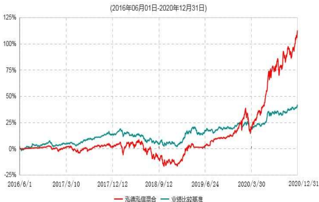
泓德泓信灵活配置混合型证券投资基金累计净值增长率与业绩比较基准收益率历史走势对比图

注：根据基金合同的约定，本基金建仓期为6个月，截至报告期末，本基金的各项投资比例符合基金合同关于投资范围及投资限制规定。