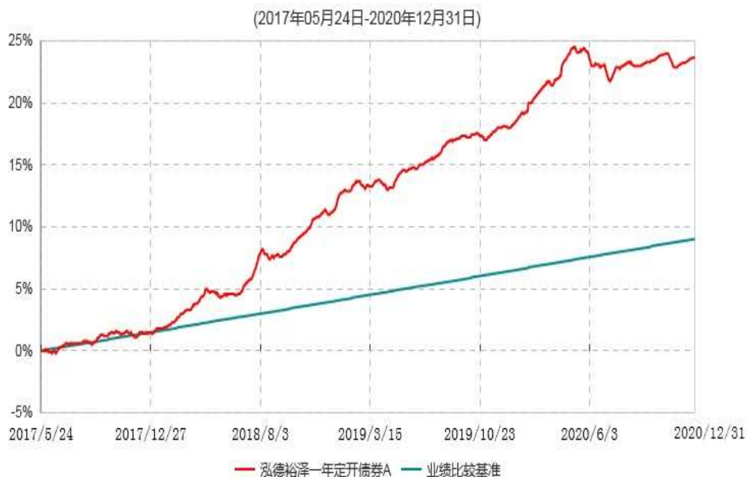
泓德裕泽一年定开债券A累计净值增长率与业绩比较基准收益率历史走势对比图