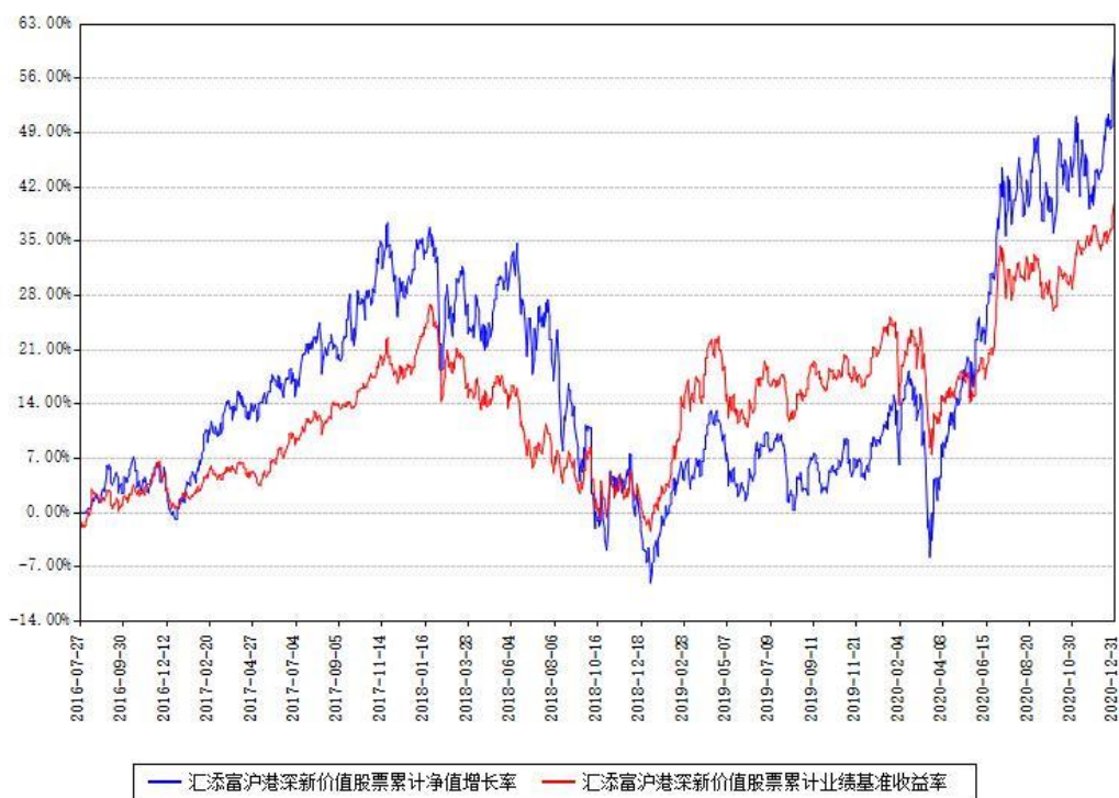
汇添富沪港深新价值股票累计净值增长率与同期业绩基准收益率对比图

注：本基金建仓期为本《基金合同》生效之日（2016年07月27日）起6个月，建仓期结束时各项资产配置比例符合合同约定。