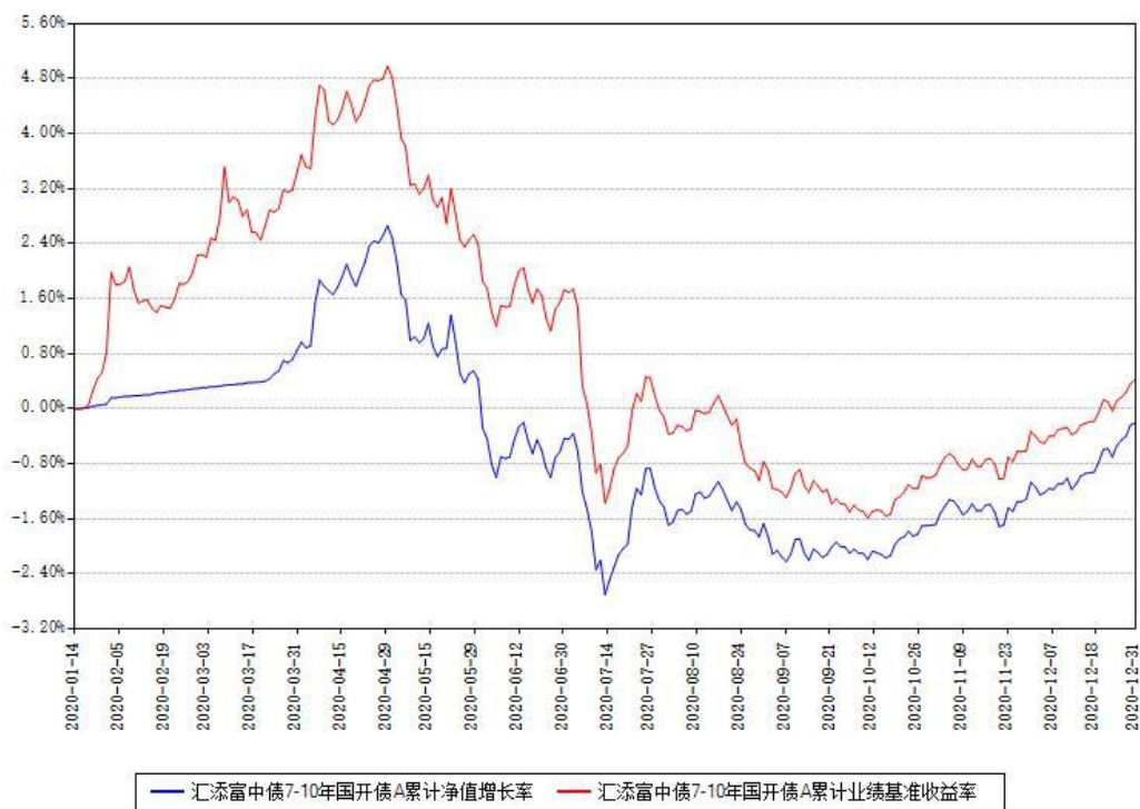
汇添富中债7-10年国开债A累计净值增长率与同期业绩基准收益率对比图