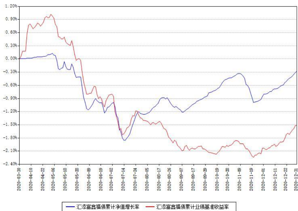
汇添富鑫福债累计净值增长率与同期业绩基准收益率对比图