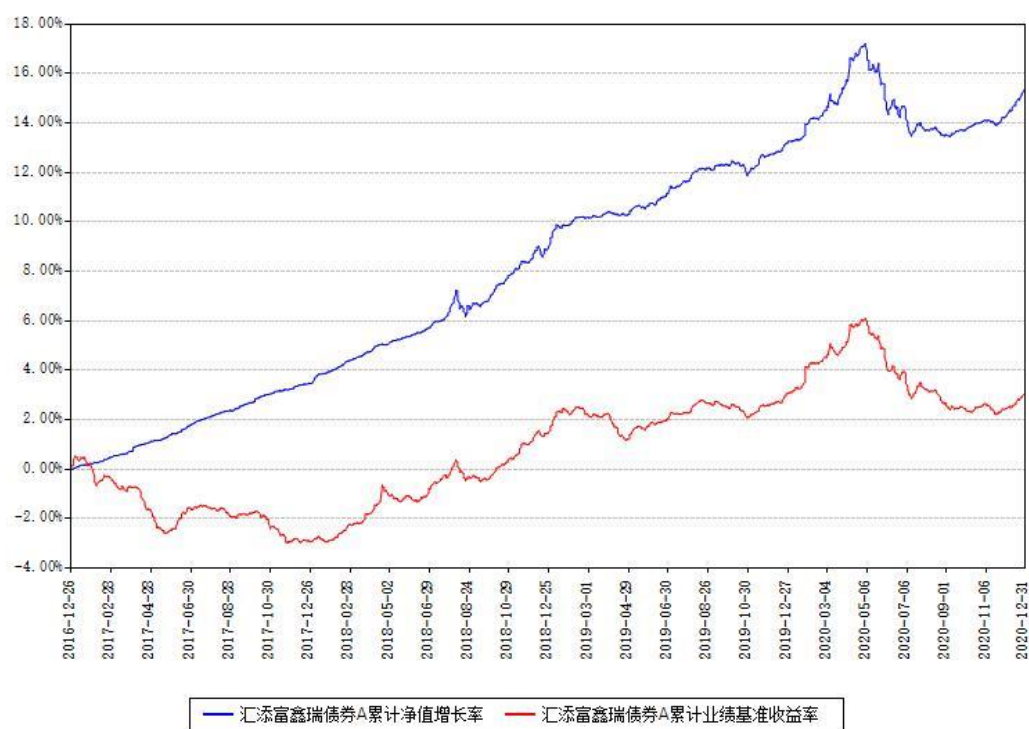
汇添富鑫瑞债券A累计净值增长率与同期业绩比较基准收益率对比图