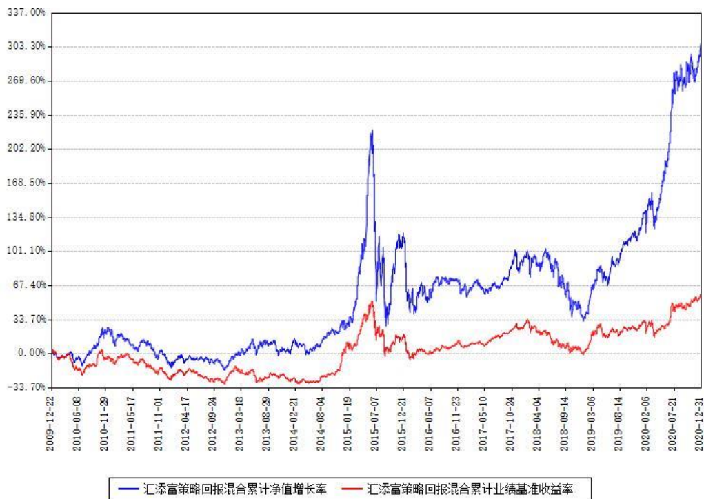
汇添富策略回报混合累计净值增长率与同期业绩比较基准收益率对比图

注：本基金建仓期为本《基金合同》生效之日（2009年12月22日）起6个月，建仓期结束时各项资产配置比例符合合同约定。