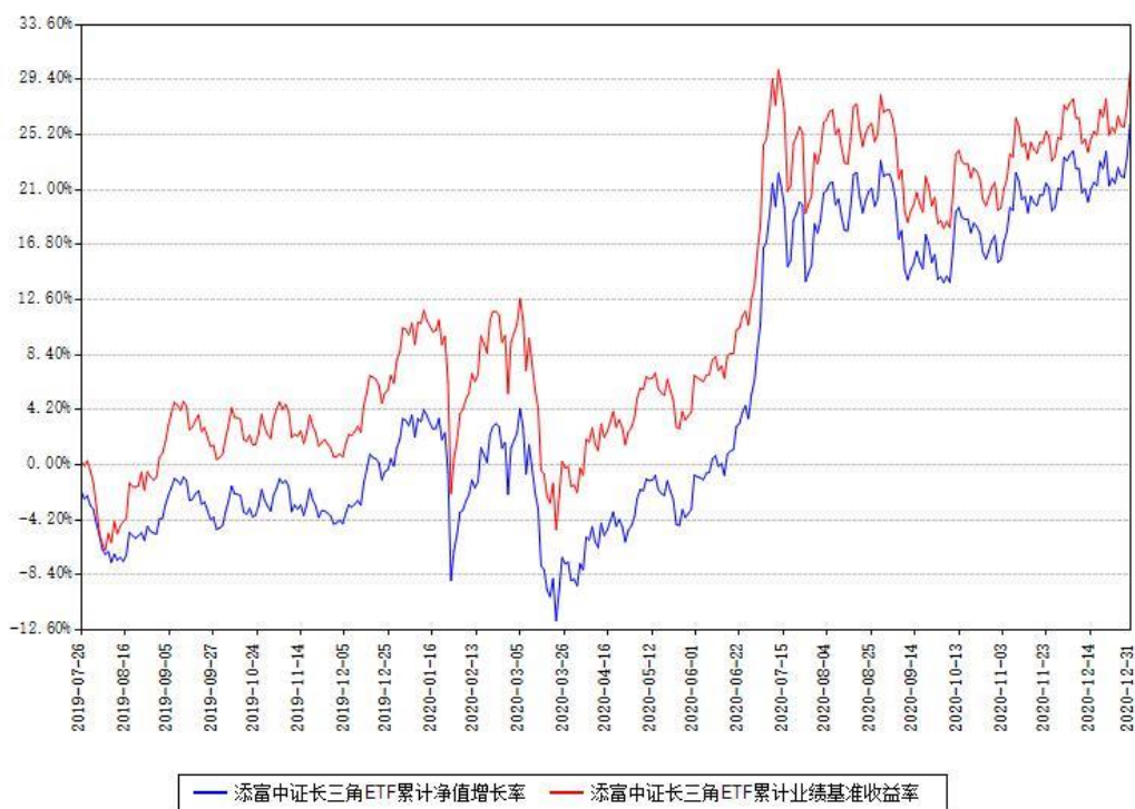
添富中证长三角ETF累计净值增长率与同期业绩基准收益率对比图

注：本基金建仓期为本《基金合同》生效之日（2019年07月26日）起6个月，建仓期结束时各项资产配置比例符合合同约定。