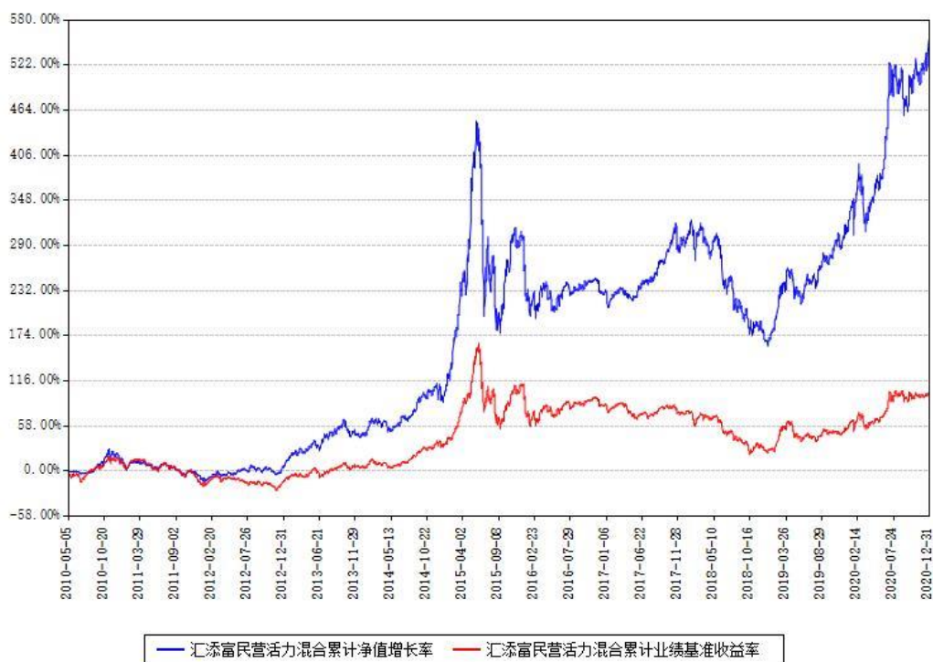
汇添富民营活力混合累计净值增长率与同期业绩比较基准收益率对比图

注：本基金建仓期为本《基金合同》生效之日（2010年05月05日）起6个月，建仓期结束时各项资产配置比例符合合同约定。