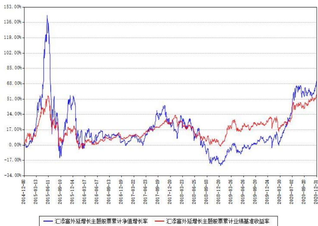
汇添富外延增长主题股票累计净值增长率与同期业绩比较基准收益率对比图

注：本基金建仓期为本《基金合同》生效之日（2014年12月08日）起6个月，建仓期结束时各项资产配置比例符合合同约定。