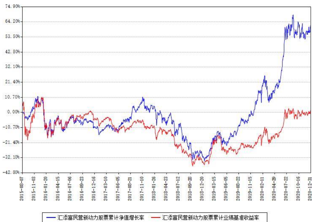
汇添富民营新动力股票累计净值增长率与同期业绩基准收益率对比图

注：本基金建仓期为本《基金合同》生效之日（2015年08月07日）起6个月，建仓期结束时各项资产配置比例符合合同约定。