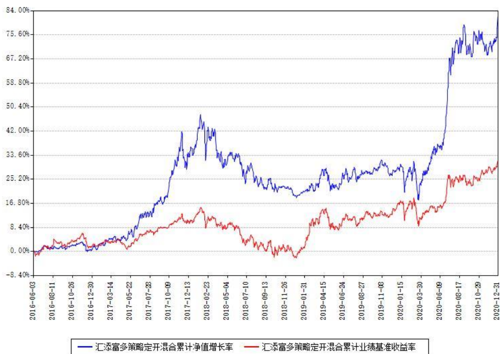
汇添富多策略定开混合累计净值增长率与同期业绩基准收益率对比图

注：本基金建仓期为本《基金合同》生效之日（2016年06月03日）起6个月，建仓期结束时各项资产配置比例符合合同约定。