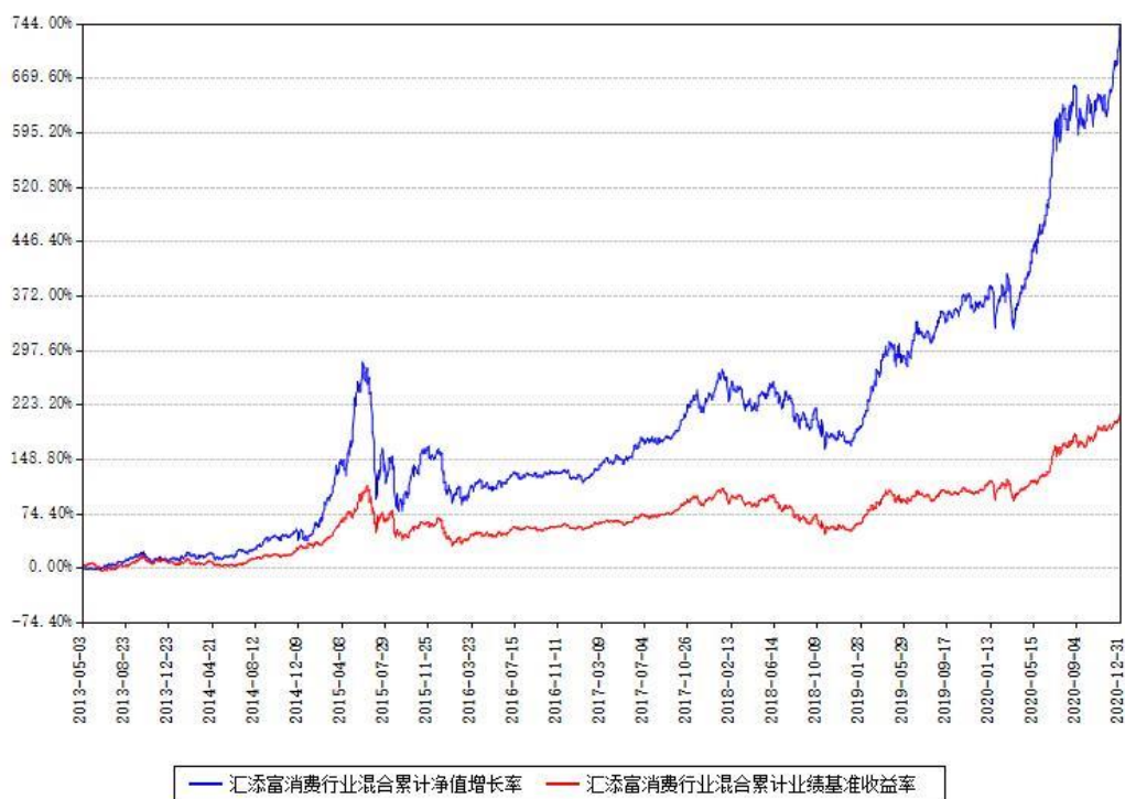
汇添富消费行业混合累计净值增长率与同期业绩基准收益率对比图

注：本基金建仓期为本《基金合同》生效之日（2013年05月03日）起6个月，建仓期结束时各项资产配置比例符合合同约定。